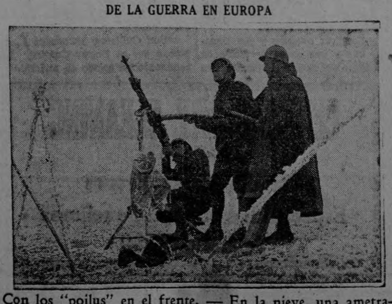
Con los "poilus" en el frente. — En la nieve, una ametralladora contra aviones, con sus sirvientes.