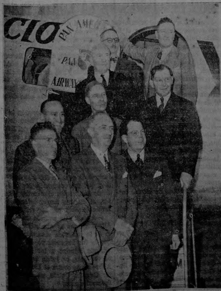
A las 11.45 de hoy aterrizó en San José el avión regular de la Pan American, procedente del norte, trayendo a bordo los nueve delegados del comercio del Estado de California. Pasa a la pág. Nueve